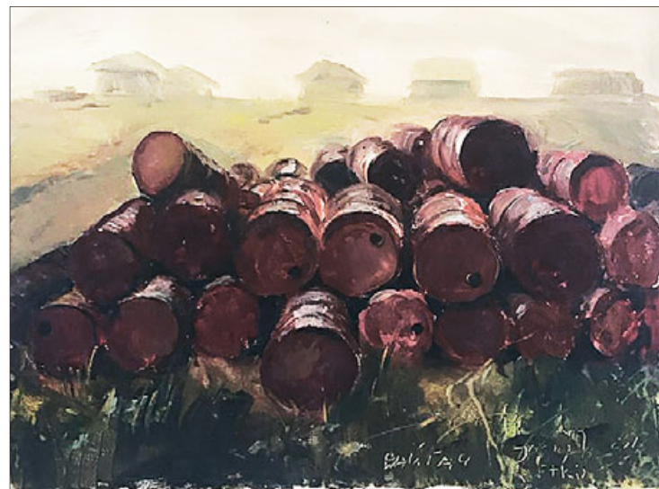
Работа Олега Сизоненко.