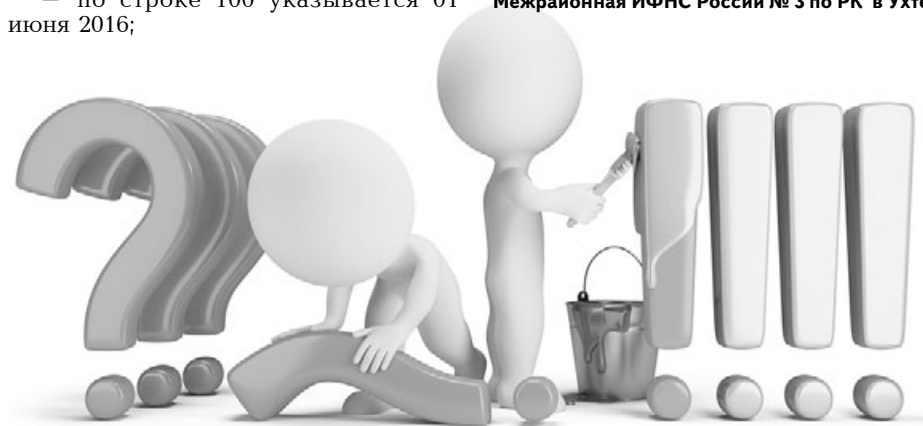
Рисунок из сети интернет

Межрайонная ИФНС России № 3 по РК в Ухте