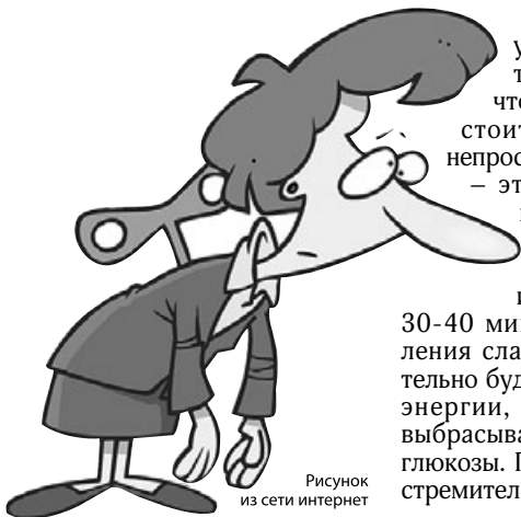
Рисунок из сети интернет

Возможно, причина упадка сил и отсутствия настроения в том, что вы сладкоежка. Вам стоит принять для себя непростую истину, что сахар – это вред! И не только потому, что сахар приводит к целому букету заболеваний и ожирению... Первые 30-40 минут после употребления сладостей вы действительно будете ощущать прилив энергии, поскольку в кровь выбрасывается огромная доза глюкозы. Правда, точно так же стремительно вы будете терять