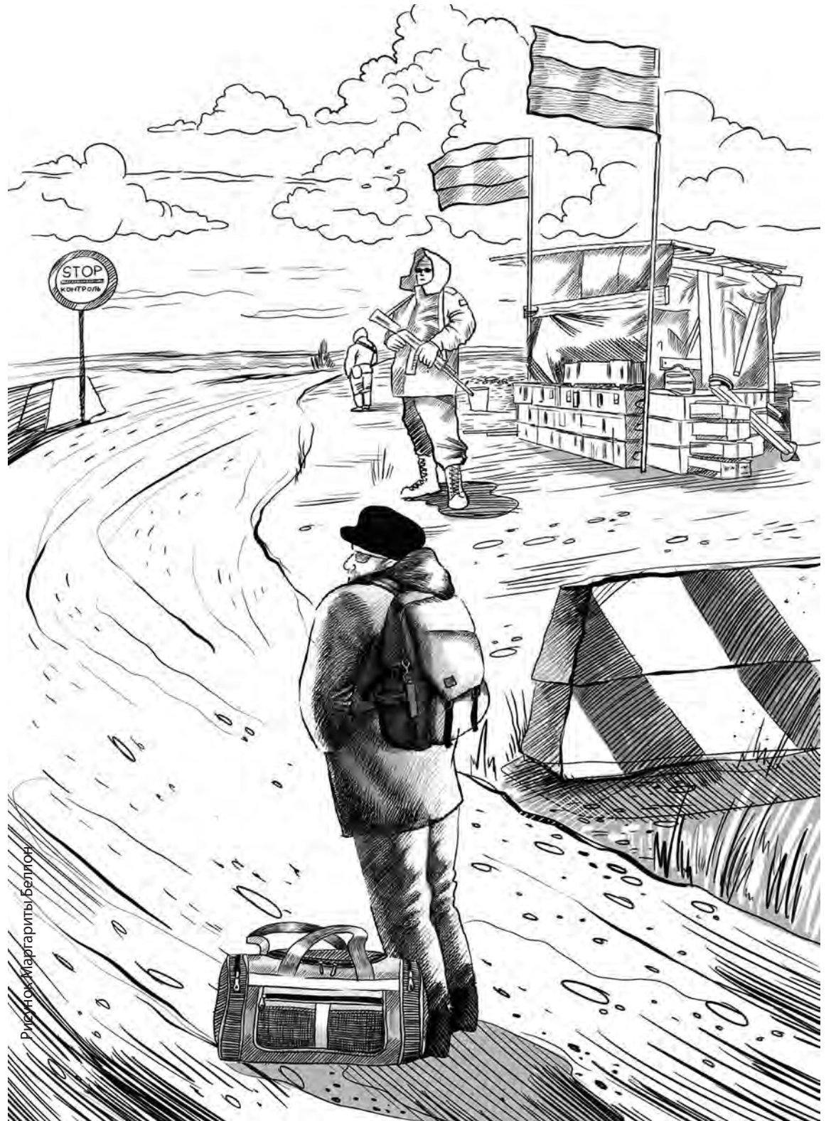
Рисунки: Маргарита Беллюччи

Пехотный полк, опытный по боям со шведами, успел дать три залпа – с колена, верхний и с передачей задней заряжающей фаланги. Залпы снесли почти треть казаков. Но ни лошади, ни лава вообще не испугались ни грохота, ни дыма – бывало и похуже. Лава влетела на штыки, кромсая пехоту.... Даже если бы до штыков долетели в атаке всего двадцать казаков, а не полторы сотни – прогноз дать за исход битвы никто бы не решился. Фифти-фифти. Пол – на пол. И летели наземь головы петровских солдат, расколотые булавами и саблями. Но и ещё с десяток – второй казаков напоролась на штыки. Проскочили на второй круг, но.... Русский драгун