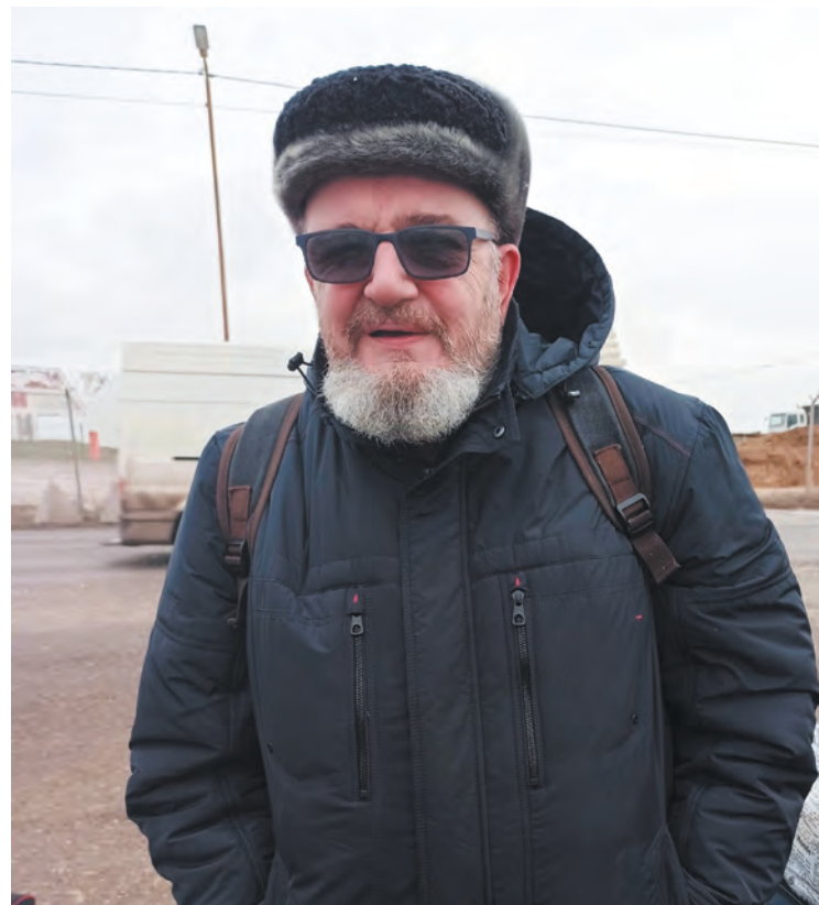
Февраль 2023. Встречай, Новороссия!